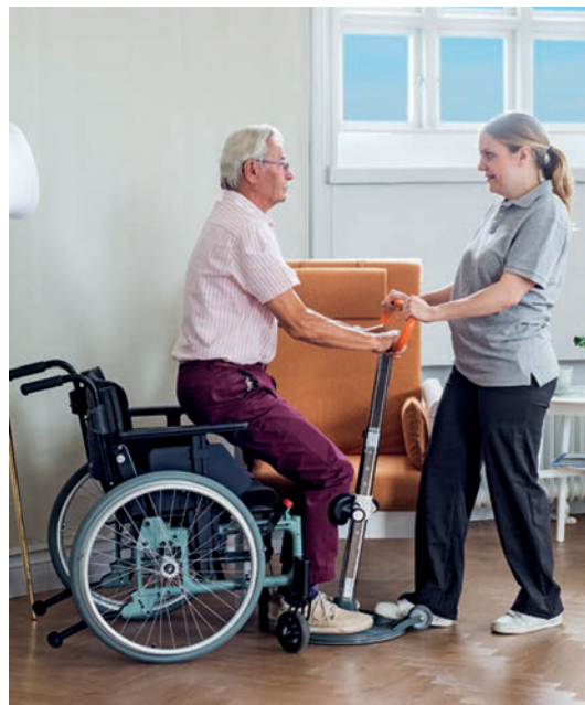
Un transfert en toute sécurité qui permet un contact visuel et une bonne communication : rassurant pour les deux participants.