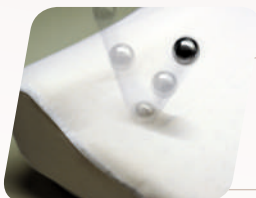
L: ≈ 47 x 33 x 14 cm, 1.16 kg item no.: 110.011