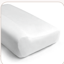
SISSEL® Classic M: ≈ 47 x 33 x 11 cm, 0.58 kg item no.: 110.005