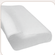
SISSEL® Soft M: ≈ 47 x 33 x 11 cm, 0.98 kg item no.: 110.020