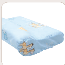
SISSEL® Bambini ≈ 37 x 25 x 9 cm, 0.60 kg item no.: 110.007