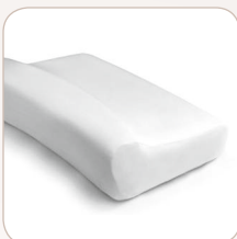
SISSEL® Test Pillow Compact ≈ 37 x 25 x 9 cm, 0.60 kg item no.: 110.019