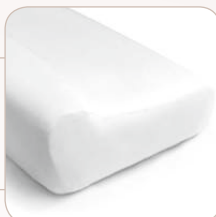
SISSEL® Plus ≈ 47 x 33 x 11/14 cm, 0.74 kg item no.: 110.001