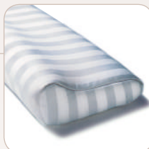
SISSEL® Deluxe ≈ 63 x 31 x 10/12 cm, 1.2 kg item no.: 110.003