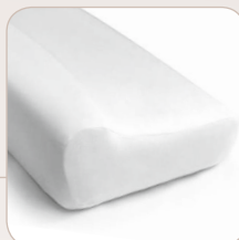
SISSEL® Soft Plus ≈ 47 x 33 x 11/14 cm, 1.16 kg item no.: 110.021