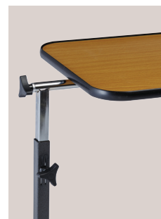
Ajustement latéral (421014)