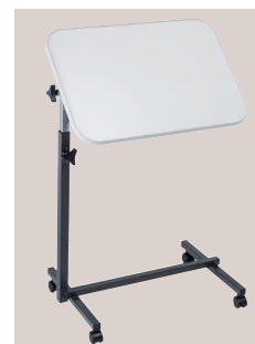
Inclinaison plateau EASY gris perle (421000)