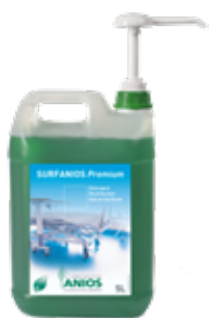
Surfanios Premium Bidon de 5L