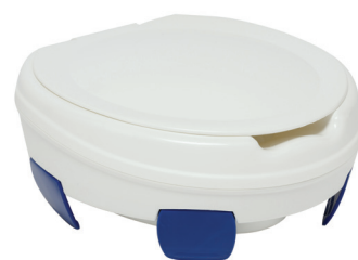
Clipper® III avec couvercle