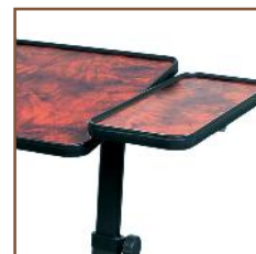
Tablette latérale en option