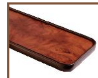
(14) ronce de noyer