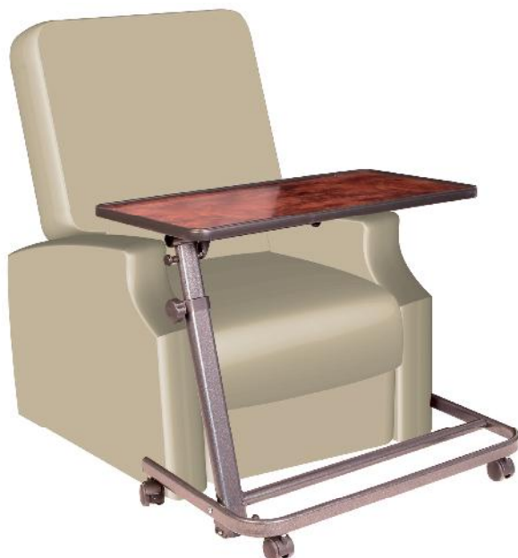
TABLE SPECIALE RELEVEUR