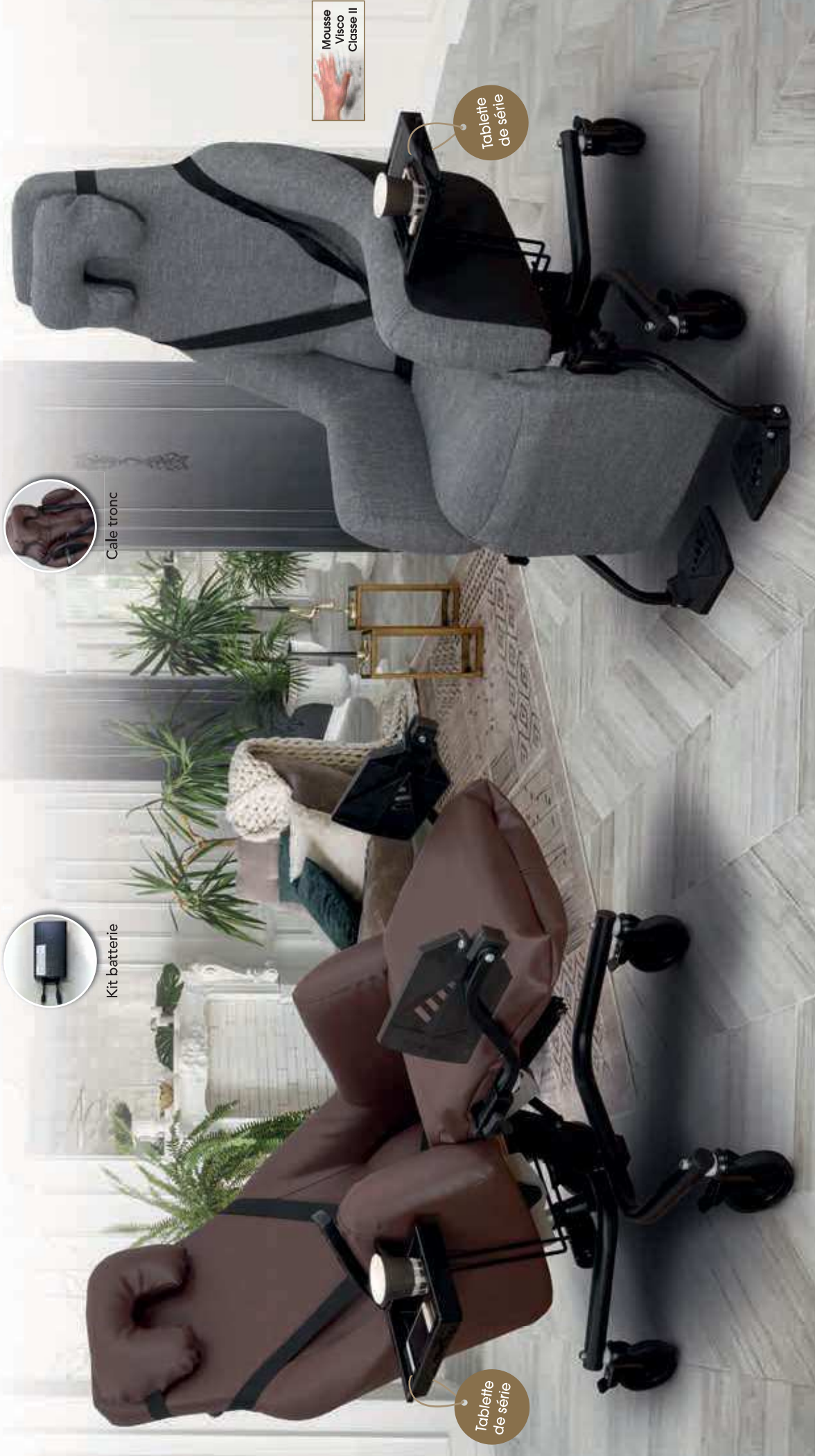
Tablette de série