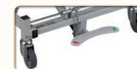
Option : freinage centralisé. Accessibilité et facilité d'activation