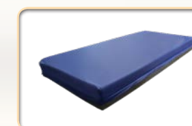
Matelas PEDIA Confort en mousse mixte viscoélastique, protégé par une housse CIC