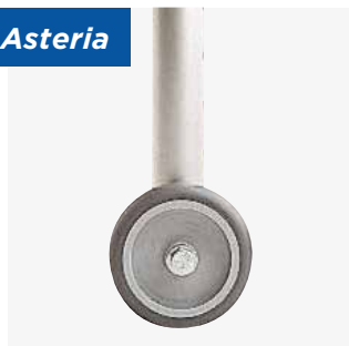
6270E : Paire de roues avant fixes (diamètre 75 mm)

Attention : les hauteurs minimum et maximum du cadre de marche sont différentes si vous y ajoutez des roues à l'avant.