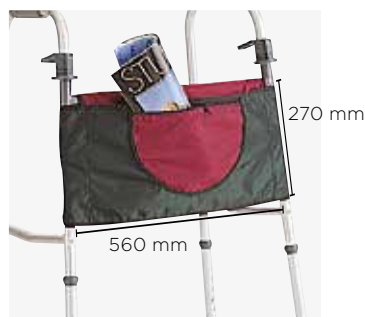
6015 : sacoche multipoche Uniquement pour Brio

Attention : les hauteurs minimum et maximum du cadre de marche sont différentes si vous y ajoutez des roues à l'avant.